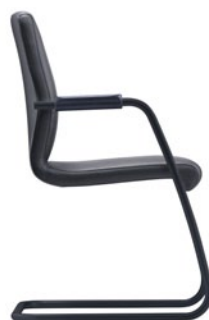
T-EV20-D0-ST entièrement en tissu empilable rembourrage des accoudoirs en cuir noir noir laqué époxy LS