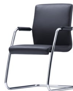
T-EV20-D0-ST entièrement en tissu empilable rembourrage des accoudoirs en cuir noir chrome brillant GV