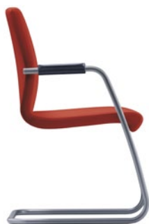
T-EV20-D0-ST entièrement en tissu empilable rembourrage des accoudoirs en plastique noir aluminium blanc LW

La collection E de sièges visiteur et de réunion est destinée à une application universelle. Agencés solennellement, ils peuvent être intégrés aux environnements les plus divers, permettant des combinaisons harmonieuses avec les aménagements existants. La coque d'assise construite d'un seul tenant offre une sensation agréable de confort. Tous les sièges sont équipés de plaquettes d'accoudoir, offrant un choix de rembourrage en cuir (en option) ou en plastique. Le piètement luge dispose d'une courbure prononcée sur le bord avant du siège. La raison pratique : aucune pression n'est exercée au dessus du creux du genou, même lors de longues périodes passées en position assise. Design: Design B4K